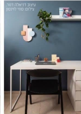
עיצוב דניאלה דטר.