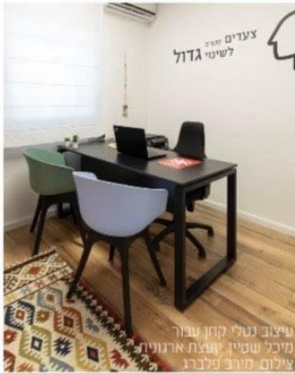
צעדים קטנים לשינוי גדול