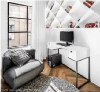
טעיב סידור גזר עילום ארית אונג