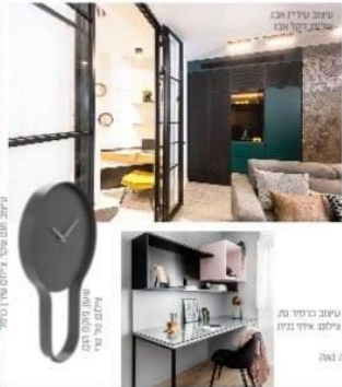
טעיב סידור גזר עילום ארית אונג