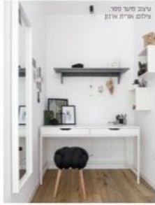
טעיב סידור גזר עילום ארית אונג