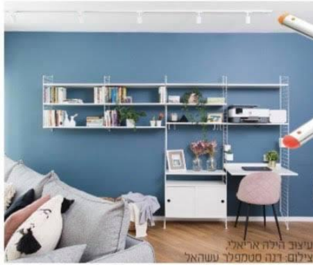
עיצוב הילה אריאלי.