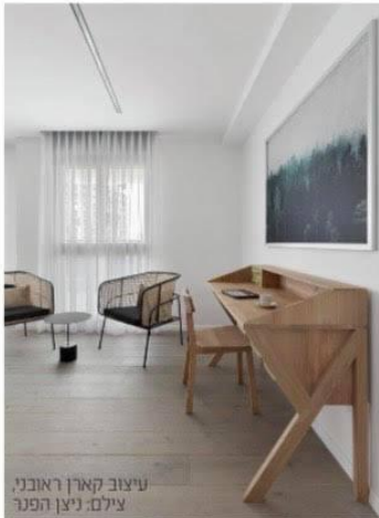
עיצוב קארן ראובני.