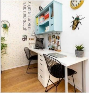
עיצוב נטשה גולדמן.