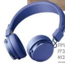
אוזניות חוטיות מתקפלות מבית Urbanears ביבוא סירוס אלקטרוניקה