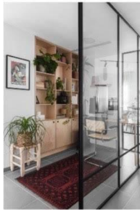
עיצוב לירון אוטמון.