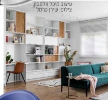
עיצוב מיכל וולפסון.