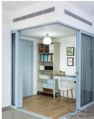
עיצוב מירב אשל.