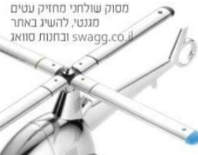
מסוק שולחני מחזיק עטים מגנטי, להשיג באתר swagg.co.il ובחנוות סוואג