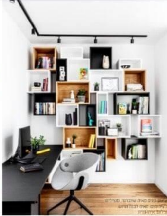
מקום גזר סידור גזר עילום ארית אונג